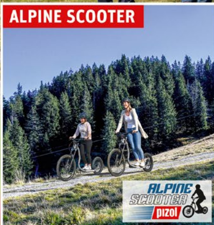
ALPINE SCOOTER PIZOL