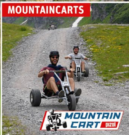
MOUNTAIN CART PIZOL