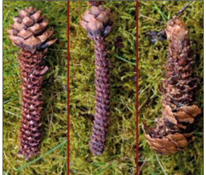
Eichhörnchen, Maus und Buntspecht hinterlassen unterschiedliche Frassspuren am Zapfen